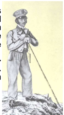
Joseph Naus 1820

Seilbahnkosten € 22,00 oder kostenlos mit Z-Ticket